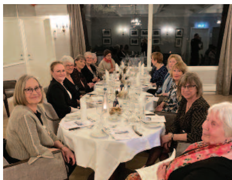
Fra middagen på årsmøtet .