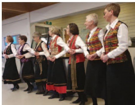
Folkedansgruppe frå Ørsta.

Flott arrangert av Ørsta IIV, ei helg med godt årsmøte, sosialt samvær og lokal kultur.