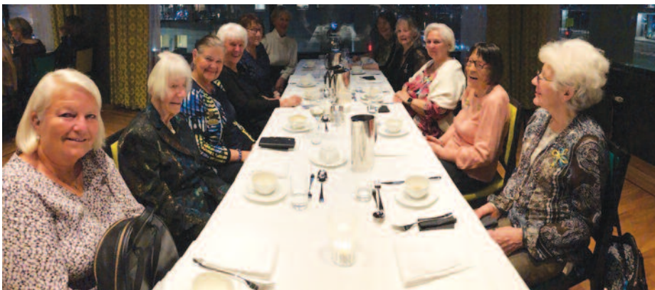
I forkant av årsmøtet ble det arrangert et "ryst sammen", som man ser var meget hyggelig.