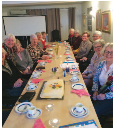
Kragerø Inner Wheel Klubb.

Tidligere i år har vi støttet Dorcas Hus med kr. 4.000,- og Narkotikahundprosjektet med kr. 4.000,-.