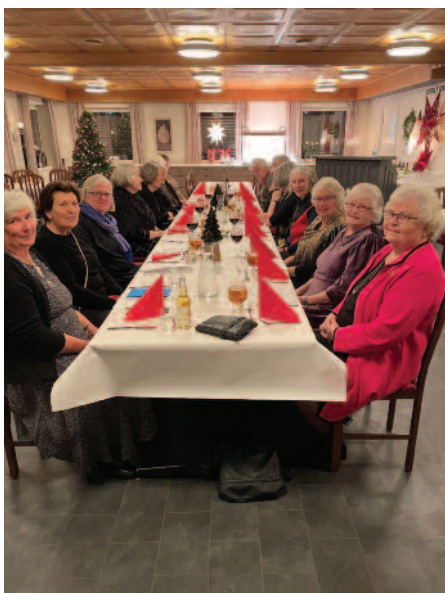
Bilde fra ETT bilde kampanjen, Julemøte i Fredriksten IW.

Som kjent ble NKN nedlagt. I stedet ble det i kjølvannet av TV-aksjonen og det positive samarbeidet mellom kvinneorganisasjonene fra ytterste høyre til ytterste venstre besluttet å danne et SENTER FOR INTERNASJONALE KVINNESPØRSMÅL- SIKS, og vi var medlem. SIKS ga ut bladet «Kvinner sammen» som gis