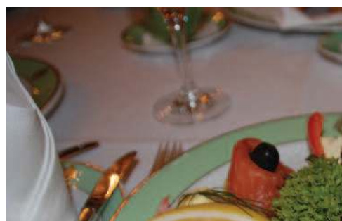
Lunsj på Bristol