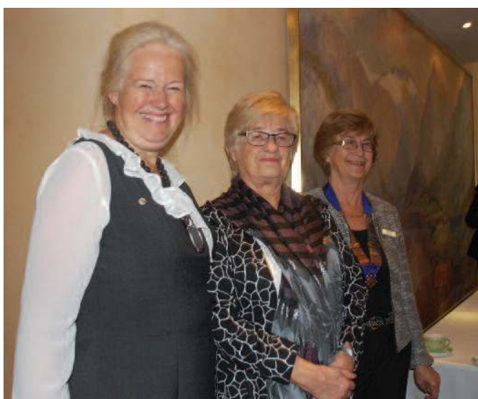
En bukett fra Jessheim