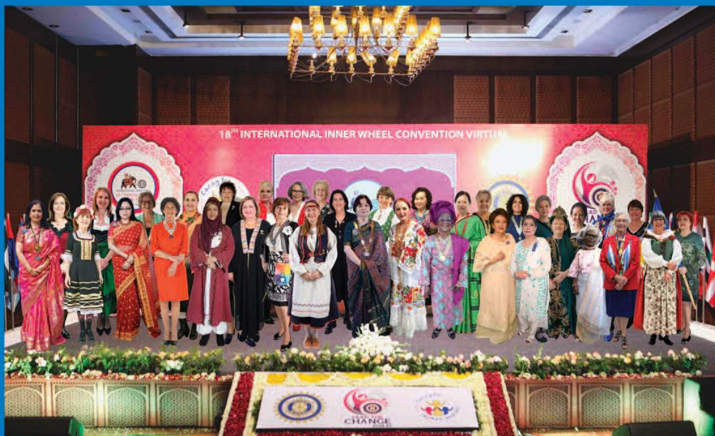
Fra Convention. Alle nasjonal-representantene er «avbildet» sammen med IIW presidenten på scenen under Convention.