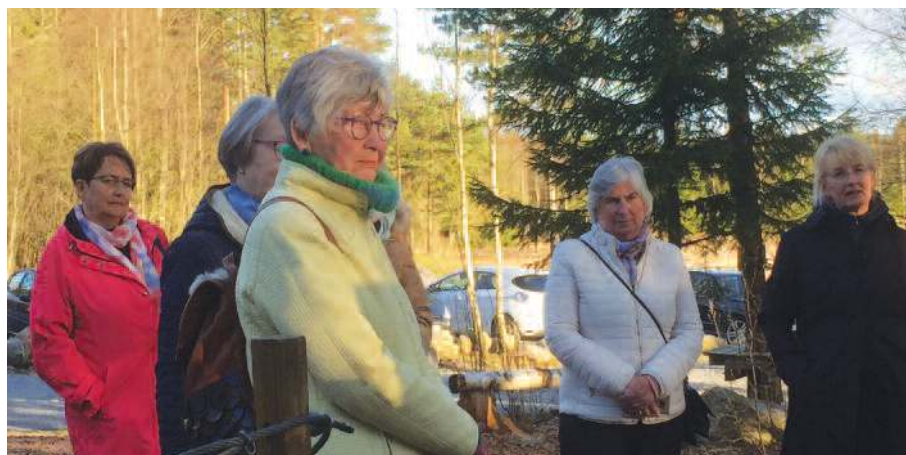
Medlemmer i Fredriksten IW.