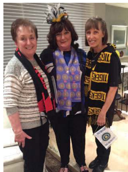
Melbourne 1 -3 klubbvenninner. Bursdagsbarnet i midten med norsk skjerf