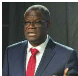
Dr. Denis Mukwege - lege og fredsprisvinner

Av disse er det Dorcas hus som har fanget vår største interesse.