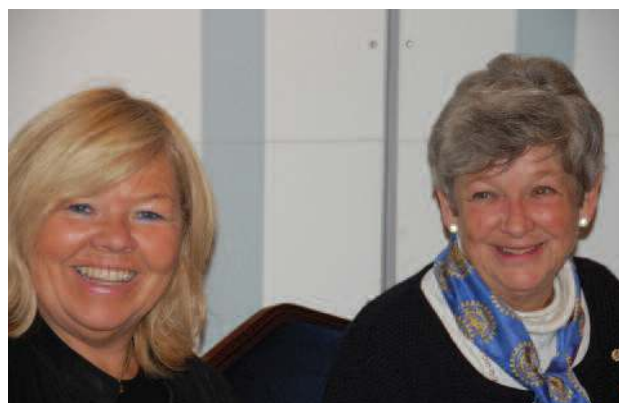
Representanter fra Halden IV