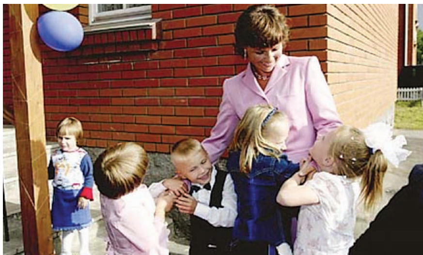
Prinsesse Märtha Louise åpnet landsbyen. Her med en glad barneflokk rundt seg.

Prosjektet ble avsluttet i juni 2005. Da hadde Inner Wheel samlet inn og betalt kr 800 000,- til SOS Barnebyen i Murmansk. Det sto fremdeles ca. kr 350 000 på SOS Barneby-kontoen og av disse pengene ble kr 176 000,- overført SOS Barnebyer i mai 2005. Resterende sum gikk til SOS-barnebyen på Sri Lanka.