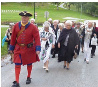
På vei til Fredriksten Festning i Halden

Første kvelden var det 1700-talls aften på Fredriksten Festning med middag og underholdning. Kvelden ble en stor suksess.