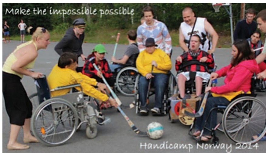
Invitasjon til Handicamp Norway 2014.

Mange klubber samlet inn penger. I flere år gikk utdelingen av rentene fra IW Norges Fond til Handicamp Norway. Beklageligvis fant Norsk