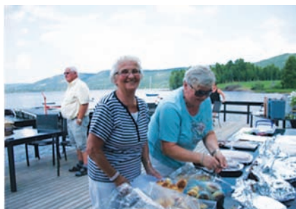
Engasjerte damer ved kakebordet.

Rotaryforum og administrerende klubb for Handicamp 2016 at dette vellykkede tiltaket ikke kunne fortsettes.