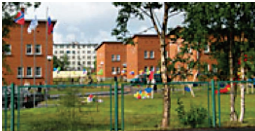
SOS-landsbyen i Kandalaksja

Prosjektet ble avsluttet i juni 2005. Da hadde Inner Wheel samlet inn og betalt kr 800 000,- til SOS Barnebyen i Murmansk. Det sto fremdeles ca. kr 350 000 på SOS Barneby-kontoen og av disse pengene ble kr 176 000,- overført SOS Barnebyer i mai 2005. Resterende sum gikk til SOS-barnebyen på Sri Lanka.