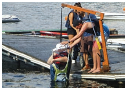
Badeliv i Hurdalsjøen.