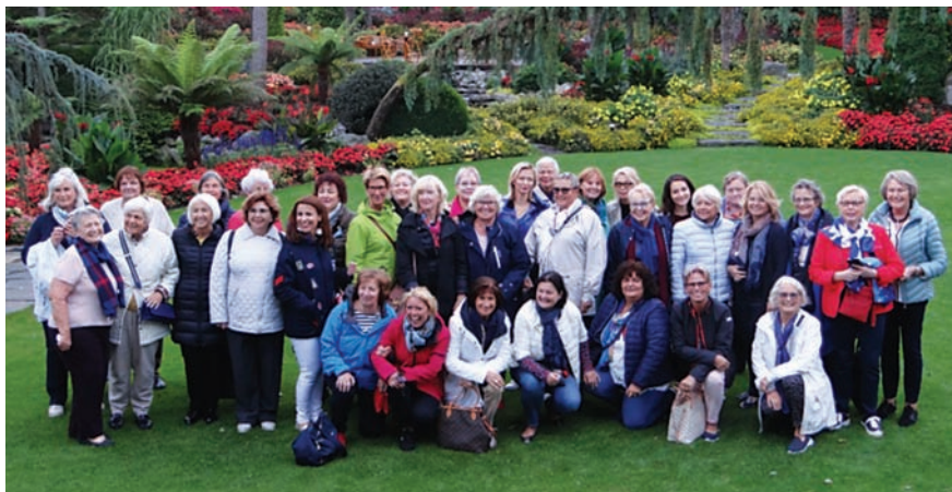
God stemning da deltagerne i EU møtet besøkte «blomsterøya» Flor og fjære på Sør-Hidle