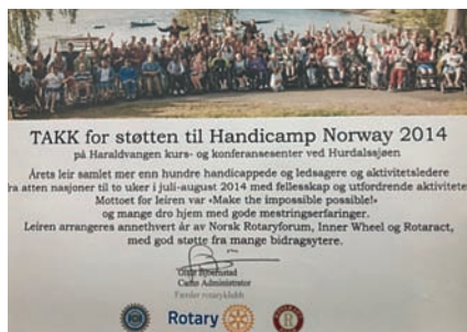
Takkekort fra Rotary.