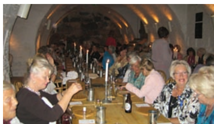
En fantastisk god og trivelig middag på festningen.

Banketten i Kultursalen om kvelden satte et flott punktum for dagen. Søndagsfrokost og utsjekking avsluttet Landstreff 2011.